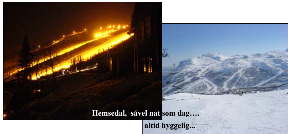
Hemsedal, såvel nat som dag.... altid hyggelig...

Vi fik en varm modtagelse af skihajer der ikke kunne vente på busafgangen, og derfor var taget til Hemsedal på egen hånd nogle dage forinden. Efter en solid morgenmad lykkes det at få alle fordelt på skiskoler, skiudlejning, røde og sorte pister eller i en køjeseng. Hen på eftermiddagen var det tid til at tømme busserne for medbragt løseøre. I år og med hjælp af vejrguderne lykkes at få busserne meget tæt på