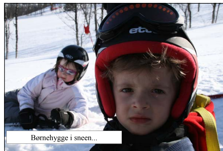
Børnehygge i sneen...